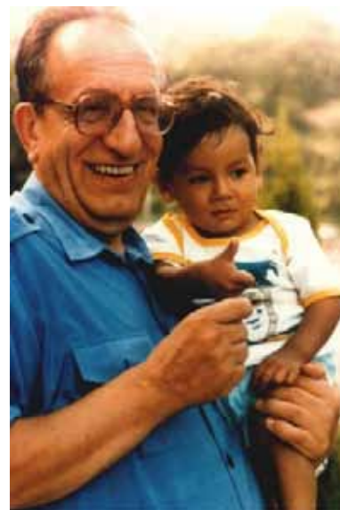
Ritratto di Ernesto Balducci

Grandissimo spazio anche per il cinema, con una programmazione estiva dedicata ai lavori dei grandi registi del mondo e con la nascita del prestigioso “Premio Fiesole ai Maestri del Cinema”, che ha visto la presenza nel Teatro Romano di registi come Mario Monicelli, Theo Angelopoulos, Wim Wenders, Robert Altman, Harold Pinter, Gianni Amelio, Nanni Moretti, Spike Lee, Aki Kaurismäki, Francesco Rosi, Ken Loach, Bernardo Bertolucci e tanti altri grandi cineasti. Ultimo premiato Toni Servillo, primo attore a ricevere il premio.